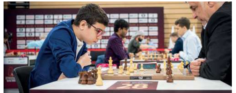
Orgullo. El bonaerense será el único sudamericano del certamen.

Competirá en el Challengers y enfrentará a jugadores de élite; el torneo no otorga puntos para norma de GM.