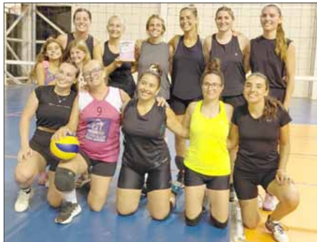
Calzonetta / Bambú, campeón femenino libre.