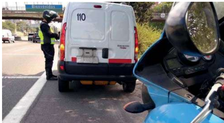
Inspección. Operativo de tránsito en verano.

vez es más común y se vincula a la "viveza criolla" tiene que ver con la falta de patente o que estén tapadas de manera intencional. En ese sentido, se detectaron 372 casos, mientras que otros 30 fueron por uso indebido de banquetas, una maniobra considerada de alto riesgo.