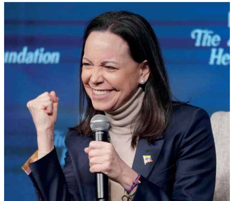
Esperanza. Corina Machado remarcó que “eventualmente tendremos elecciones libres y justas” en Venezuela.

Machado agregó que su mensaje para el pueblo venezolano es que Venezuela será libre, y eso se logrará con el apoyo del pueblo de Estados Unidos y del presidente Donald Trump”.