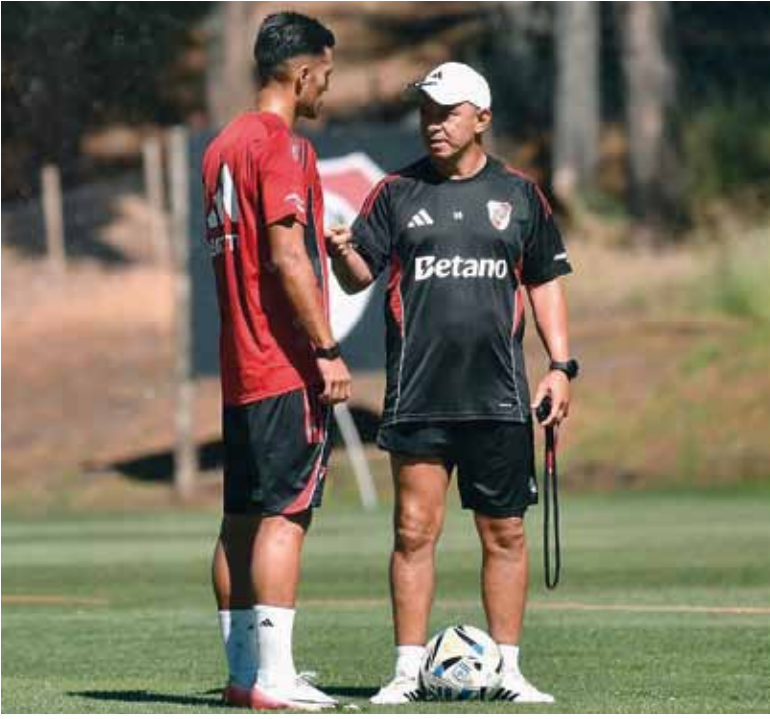
Test. Gallardo busca consolidar el once.

En la portería, Santiago Beltrán volverá a ocupar el arco mientras Franco Armani se recupera de su lesión, buscando reaparecer en el debut oficial frente a Barracas Central. La defensa podría sufrir un solo cambio: Matías Viña podría ingresar por Facundo González como lateral izquierdo, ante la ausencia de Marcos Acuña, todavía afectado por una dolencia. La idea del cuerpo técnico es mantener una base estable, pero ir definiendo un once titular de cara a la temporada, algo que difiere de 2025, cuando los nombres variaban partido a partido.