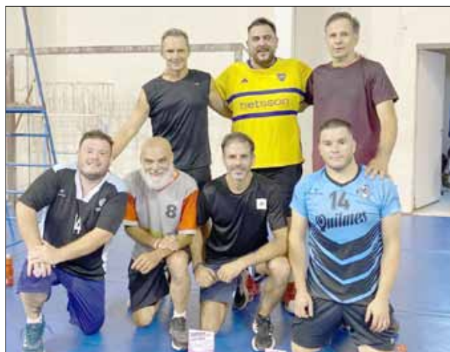
La Madriguera / Oxi Maq, campeón masculino +35.