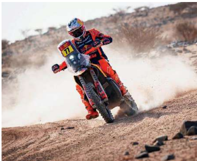
A todo o nada. El salteño va por la gloria.

Sin embargo, el desarrollo cambió según avanzaba el tramo de 311 kilómetros entre Al-Henakiyah y Yanbu. Cerca del kilómetro 94, el piloto de Honda logró