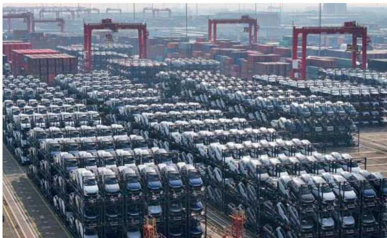
Importación. El funcionario dijo que la medida apunta a beneficiar al consumidor argentino.

Según el funcionario, la medida busca beneficiar al consumidor argentino, que durante mucho tiempo enfrentó precios elevados y escasez de modelos disponibles. “Cuando restringís la oferta, sube el precio. Cuando ampliás la oferta, el precio baja”, reiteró.