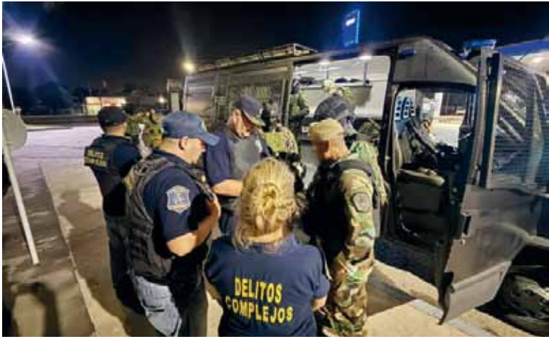
Crimen planificado. Los investigadores determinaron cómo operó la red detrás del asesinato.

A partir de testimonios y tareas de inteligencia, los investigadores establecieron que la víctima residía en un departamento alquilado junto a una mujer joven. Vecinos del lugar declararon que,