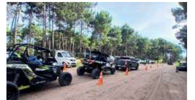
Un control en las playas de Pinamar.

En medio de otro verano con accidentes en las playas de Pinamar y otros distritos costeros, el intendente de Villa Gesell, Gustavo Barrera, anunció que impulsará un proyecto para modificar la Ley de Tránsito, con el objetivo de endurecer las penas contra quienes provoquen accidentes viales y contra conductas de conducción irresponsable.