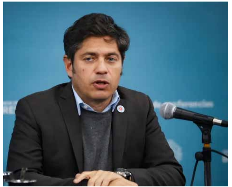
Entendimiento. Se produjo tras una serie de encuentros virtuales entre funcionarios bonaerenses y dirigentes gremiales.

Los gremios pedían un retroactivo que empardara la inflación de esos dos meses, 2,5% y 2,8% respectivamente. Pero finalmente aceptaron algo menos: el retroactivo del 0,5% del medio aguinaldo y el 1% de diciembre, que el gobierno combinó con una suba de un punto en el incremento de enero, que en un principio ubicó en el 1% y después elevó al 2.