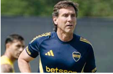
El DT piensa en el rodaje para una temporada larga.